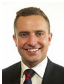
Tomas Tobé Gävleborg